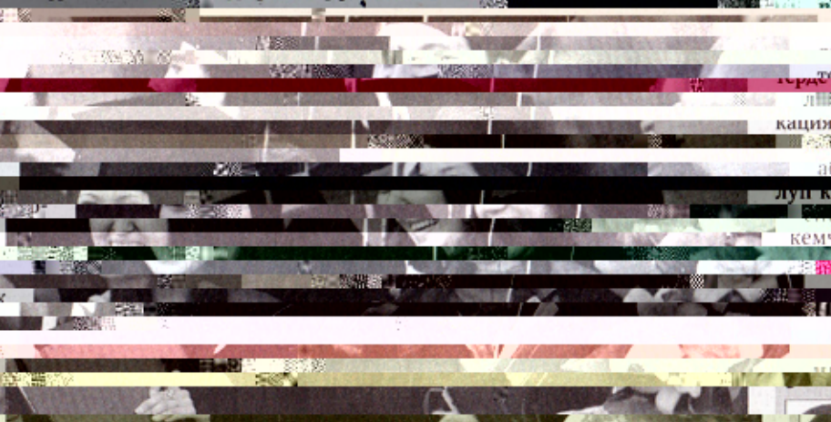
Жаңы муун академиясындагы окуучулардын үч маалтагагына гана гондуктан ала энесинин алыстыгын эске алып, мыкты шарттар түзүшөт.

– Ошондо аймактардан жыл сайын алынып келинчү. Жыл сайын бир жылдык тамактардын маалымдары, үч маалтагагы кошо кирет. Академияда окуучулардын үч маалтагагына гана гондуктан ала энесинин алыстыгын эске алып, мыкты шарттар түзүшөт.